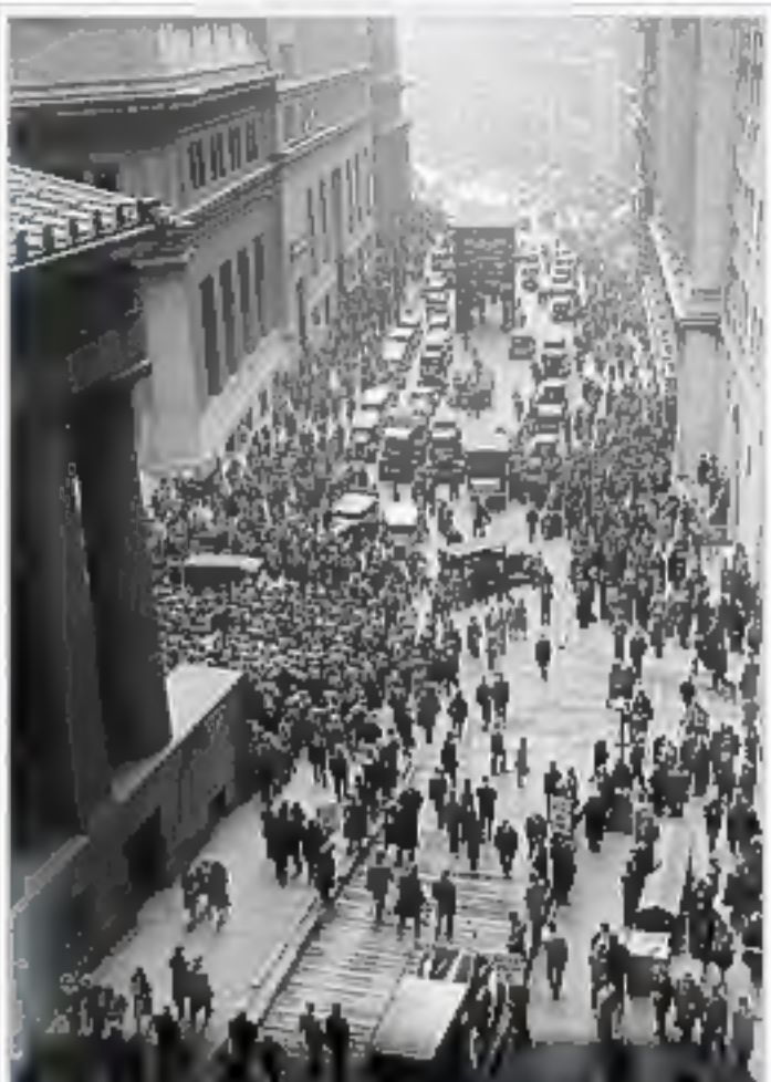
Uma multidão à porta da Bolsa de Nova Iorque.

Milton Friedman em Uma História Monetária dos Estados Unidos ( A Monetary History of the United States ), co-escrito com Anna Schwartz , avança o argumento de que o que fez a "grande contração" tão grave não foi a desaceleração do ciclo econômico, foi o protecionismo, ou o crash de mercado de ações de 1929 em si – mas, segundo Friedman, o que mergulhou o país numa profunda depressão foi o colapso do sistema bancário durante três ondas de pânico durante o período 1930-33. [16]